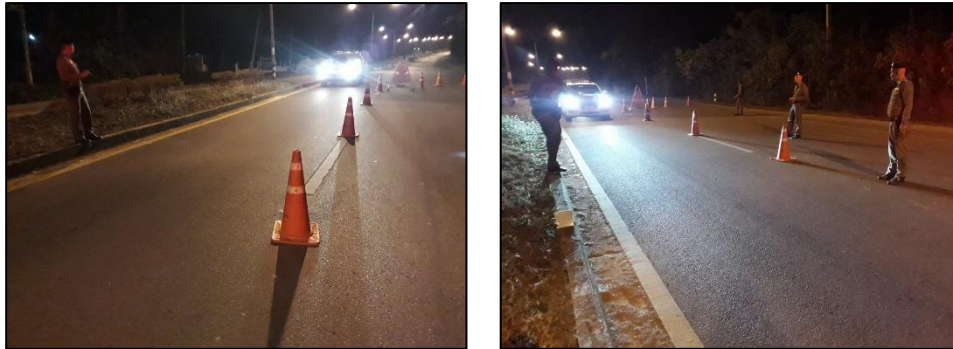
จับกุม ๑๐ ฐานความผิด เดือน มีนาคม ๒๕๖๙

โดยการอำนวยความสะดวกของ พ.ต.อ.ภีมพัฒน์ โกษาธรสุวรรณ ผกก.สภ.เรือง จว.น่าน มอบหมายให้ พ.ต.ท.สุพรรณ วิญญูพรหม สวป.สภ.เรือง พร้อมด้วยชุดปฏิบัติการจราจรและเจ้าหน้าที่สายตรวจ ตั้งจุดตรวจ กวดขันวินัยจราจร ณ บริเวณหน้าที่ทำการองค์การบริหารส่วนตำบลถ้ำมด